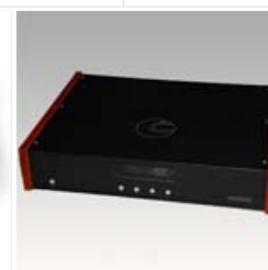
Tentlabs DIY hybride versterker