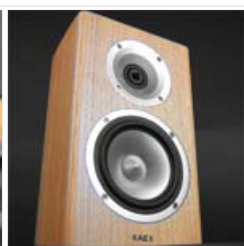
Acoustic Energy Radiance One