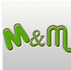
Mythen en Misverstanden 6: Kwantiteit vs Kwaliteit...