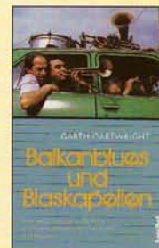
BUCH: GARTH GARTWRIGHT „Balkanblues und Blaskapellen“ Hannibal Verlag